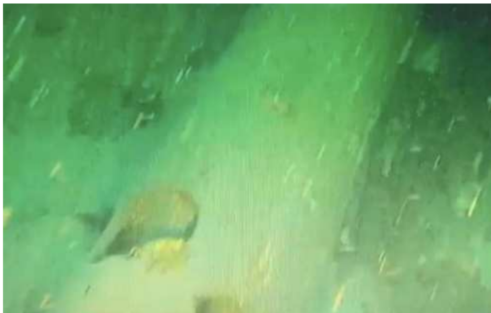
Resterna av den amerikanska torpeden nära Nord Stream-rörledningens explosionsplats, datorbild tagen från dold kamera

Enligt tillförlitliga källor hittades en amerikansk torped vid explosionsplatsen för gasledningen Nord Stream. Det var torpedtypen som bars av Arleigh Burke-klassens styrda missiljagare USS Paul Ignatius (DDG 117) – RGM-84 harpunmissil. Harpunen har varit det primära antiskeppsvapnet i den amerikanska flottan, den har en räckvidd på 300 km och är känd som en "skeppsmördare".